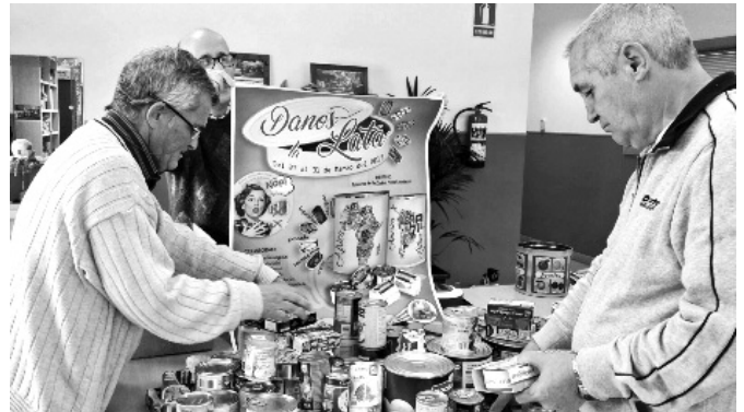
Campaña Danos la Lata en el Centro San Juan de Dios de Valladolid.