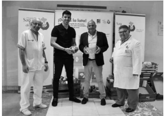
Campaña Danos la Lata en el Hospital San Juan de Dios de Zaragoza.

Los alimentos siguen siendo uno de los productos más demandados por nuestras contrapartes, ya que no siempre son fáciles de conseguir o tienen un precio muy elevado. Por tanto, este apoyo que reciben los centros de destino permite dar la mejor calidad posible en los servicios que presta la Orden con las personas en situación de vulnerabilidad a las que atiende.