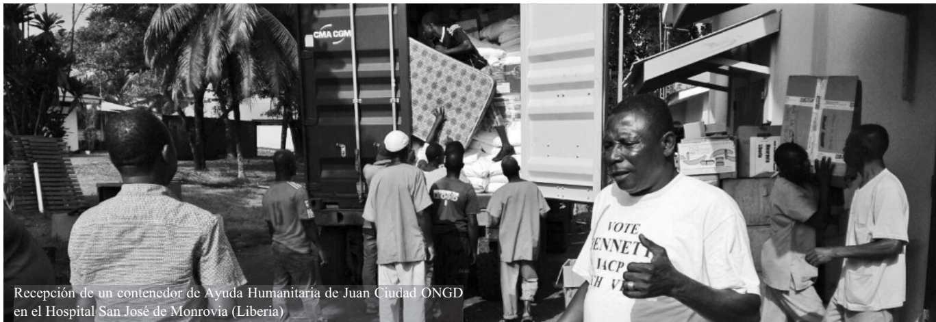
Recepción de un contenedor de Ayuda Humanitaria de Juan Ciudad ONGD en el Hospital San José de Monrovia (Liberia)