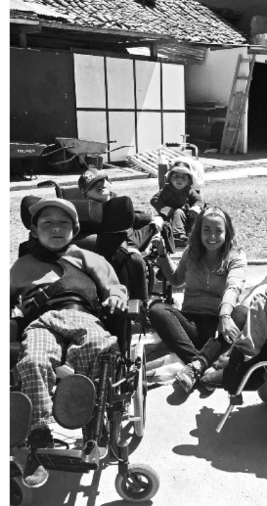
Ana Belén durante su estancia en la Clínica SJD de Cuzco, dedicada a la atención de infancia con discapacidad.