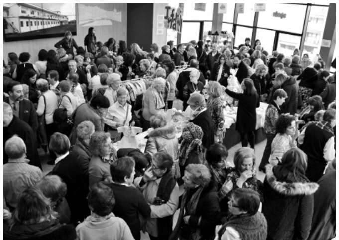
IX Mercadillo Artesanal Solidario en el Hospital San Juan de Dios de Santurtzi.

Gracias a la solidaridad de todas las personas que han colaborado de diferentes formas con este mercadillo, se ha logrado una recaudación total de 15.635 euros, que serán destinados a mejorar la salud en Liberia.