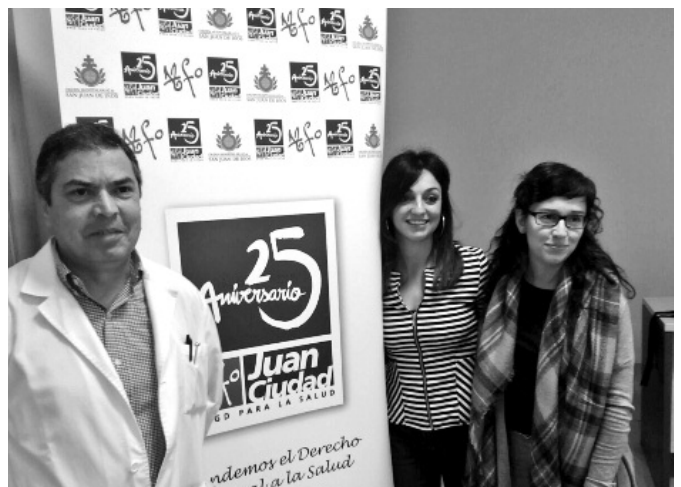
Presentación de la ONGD en el Sanatorio Marítimo de Gijón.

Además, el centro ha tenido durante dos semanas una exposición con fotografías de los hospitales y centros sanitarios de la Orden Hospitalaria de San Juan de Dios en África, con los que colabora Juan Ciudad ONGD a través de sus proyectos de cooperación, el voluntariado, la ayuda humanitaria y la sensibilización.