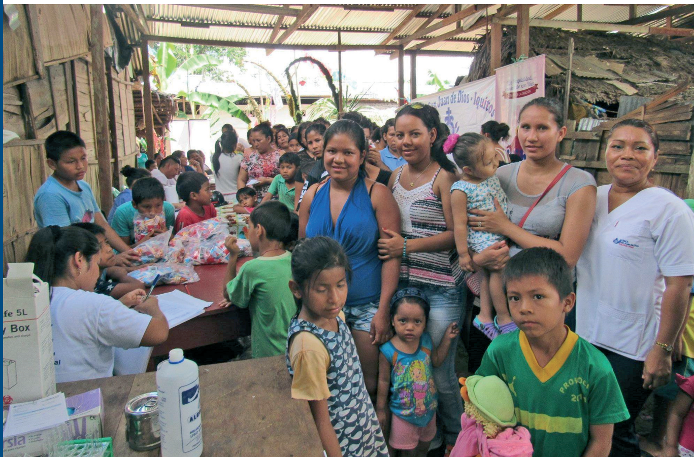
Campaña de Mensajeros de la Salud de la Clínica San Juan de Dios de Iquitos en la selva peruana, donde se atiende gratuitamente a personas que viven en lugares de difícil acceso.

ANDALUCÍA - Eduardo Dato, 42 - 41005 Sevilla ARAGÓN- Paseo de Colón, 14 - 50006 Zaragoza ASTURIAS - Avda. José García Bernardo, 708 - 33203 Gijón BALEARES - Psg. Cala Gamba, 35 - 07007 Palma de Mallorca CANARIAS - El Lasso, s/n - 35080 Las Palmas de G.C. CANTABRIA - General Dávila, 35 - 39006 Santander CASTILLA Y LEÓN - Avda. Madrid, nº68 - 47008 Valladolid CATALUÑA - Dr. Antoni Pujadas, 40 - 08830 St. Boi de Llobregat EXTREMADURA - Pº de la Piedad, 5. 06200 Almendralejo (Badajoz) GALICIA - San Juan de Dios, 1 - 36208 Vigo MADRID - Herreros de Tejada, 3 - 28016 Madrid MURCIA - Ctra. Sta. Catalina, 55 - 30012 Murcia NAVARRA - Beloso Alto, 3 - 31006 Pamplona PAÍS VASCO - Gesalibar Auzoa, 14. 20509 Arrasate-Mondragón VALENCIA - Luz Casanova, 8 - 46009 Valencia