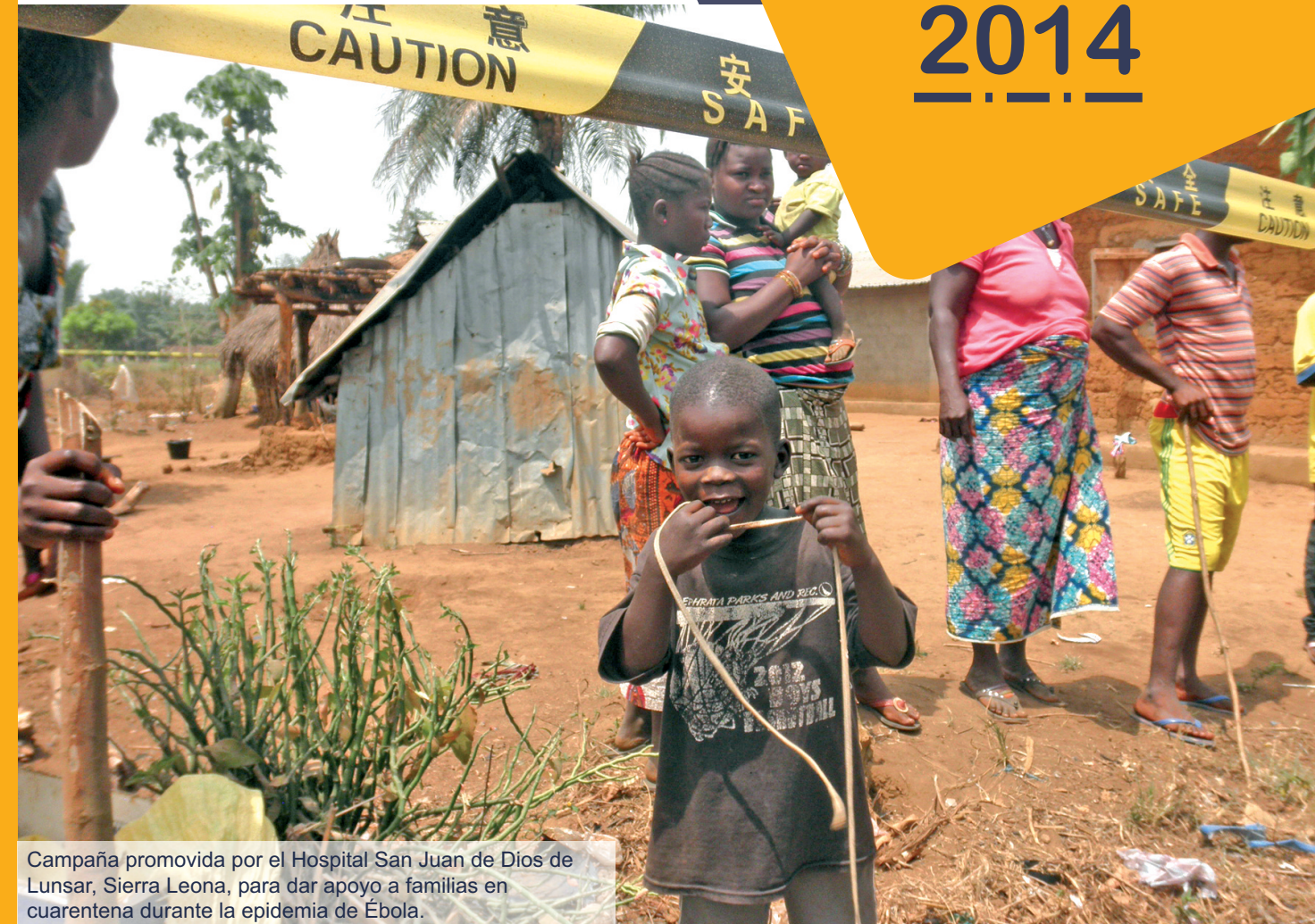
Campaña promovida por el Hospital San Juan de Dios de Lunsar, Sierra Leona, para dar apoyo a familias en cuarentena durante la epidemia de Ébola.