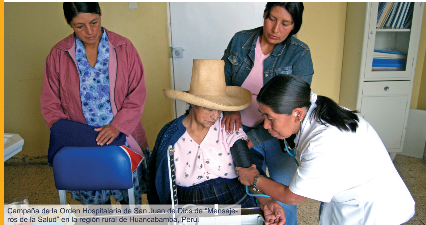
Campaña de la Orden Hospitalaria de San Juan de Dios de "Mensajes de la Salud" en la región rural de Huancabamba, Perú.

En 2014 Juan Ciudad ONGD ha gestionado 37 proyectos en África, América Latina y Asia, ha enviado 30 contenedores de ayuda humanitaria a distintos centros hospitalarios, ha contado con 65 personas voluntarias, y ha promovido numerosas campañas de sensibilización, como Danos la Lata o Pobreza Cero.