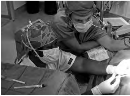
Imágenes de la Campaña de Cirugía Pediátrica realiza del 29 de Septiembre al 7 de Octubre de este año en dos hospitales de San Juan de