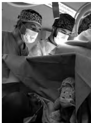
Imágenes de la Campaña de Cirugía Pediátrica realizada este año en Liberia y Sierra Leona.

boca a boca. La convocatoria siempre atrae a mucha gente, y a pesar de que el quirófano se mantiene funcionando al máximo de sus posibilidades, mañana y tarde hasta seis días a la semana, no es posible atender todos los casos.