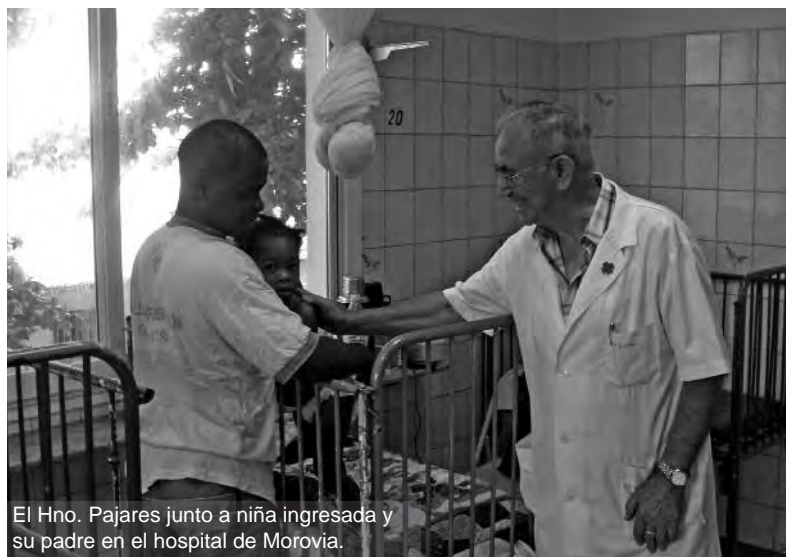
El Hno. Pajares junto a niña ingresada y su padre en el hospital de Morovia.

En las siete Campañas realizadas en Liberia, Ghana, Benín y Sierra Leona se han operado 230 niños y niñas de familias sin recursos.