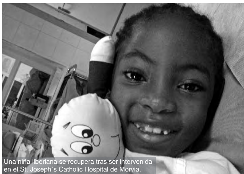
Una niña liberiana se recupera tras ser intervenida en el St. Joseph's Catholic Hospital de Morvia.