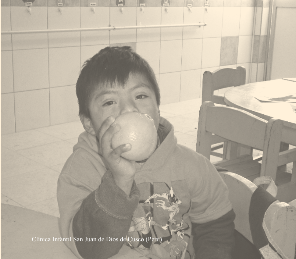
Clínica Infantil San Juan de Dios de Cusco (Perú)

Atendemos a personas de todas las edades sin ninguna distinción.