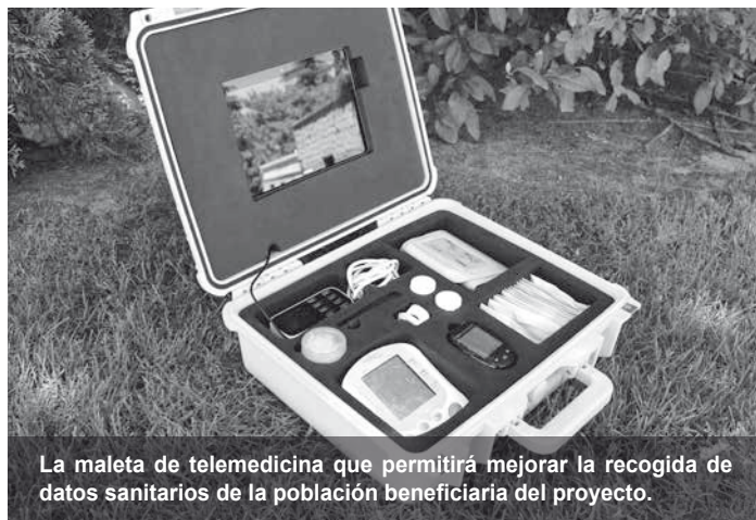
La maleta de telemedicina que permitirá mejorar la recogida de datos sanitarios de la población beneficiaria del proyecto.