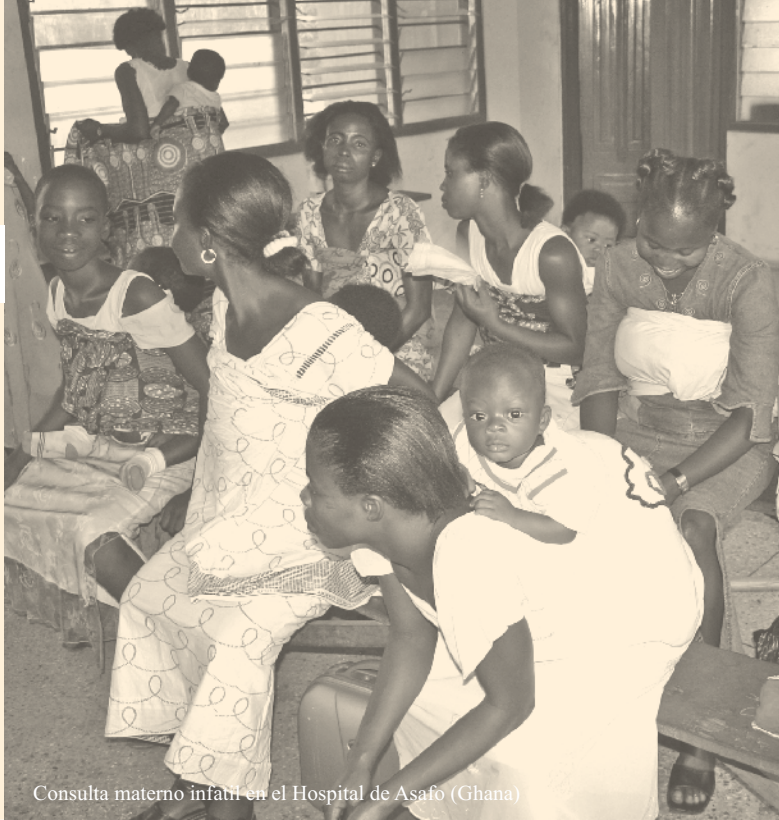
Consulta materno infantil en el Hospital de Asafo (Ghana)

Recorta, completa y envíanos este cupón.