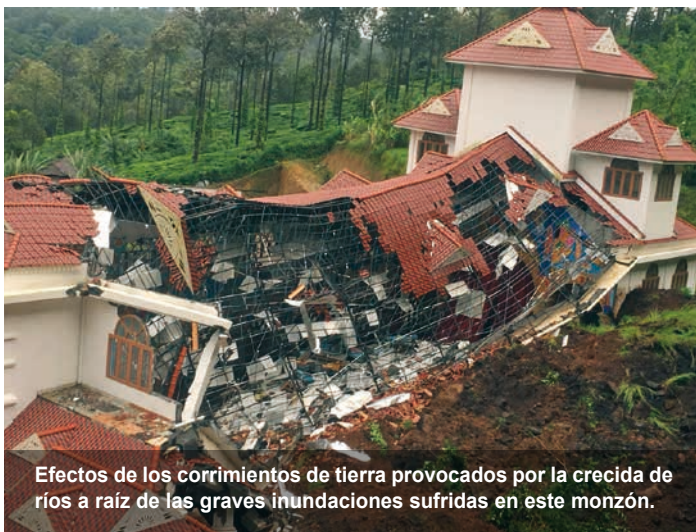
Efectos de los corrimientos de tierra provocados por la crecida de ríos a raíz de las graves inundaciones sufridas en este monzón.