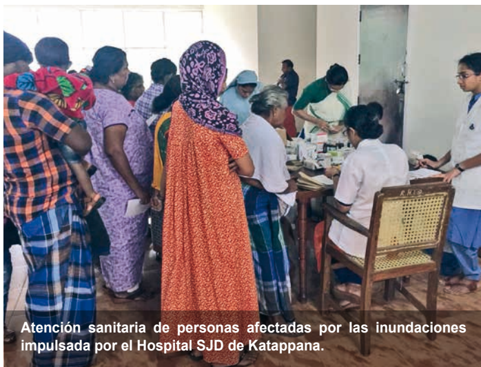
Atención sanitaria de personas afectadas por las inundaciones impulsada por el Hospital SJD de Katappana.