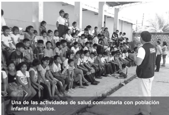
Una de las actividades de salud comunitaria con población infantil en Iquitos.