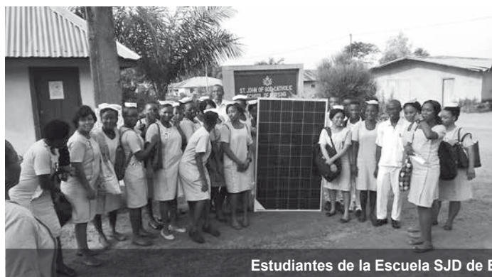
Estudiantes de la Escuela SJD de Enfermería del Hospital SJD de Lunsar.