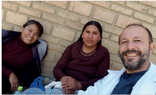
Instituto Psicopedagógico SJD de Cochabamba (Bolivia)