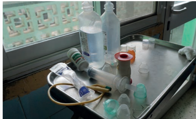
Hospital Católico San José de Monrovia (Liberia)

Todo esto ha sido posible gracias a la implicación de los delegados autonómicos de Juan Ciudad ONGD y muchas personas voluntarias que les ayudan, así como los Centros de San Juan de Dios, Hermanos y sus colaboradores.