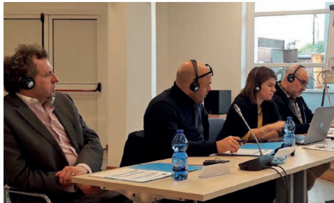
Curia General de Roma (Italia)