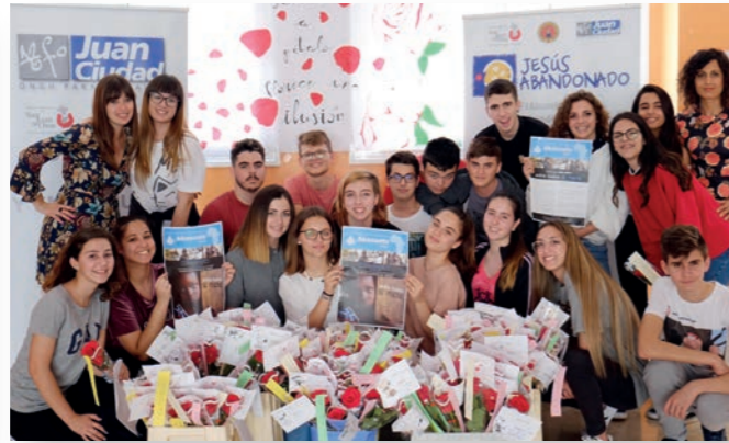
Fundación Jesús Abandonado (Murcia)