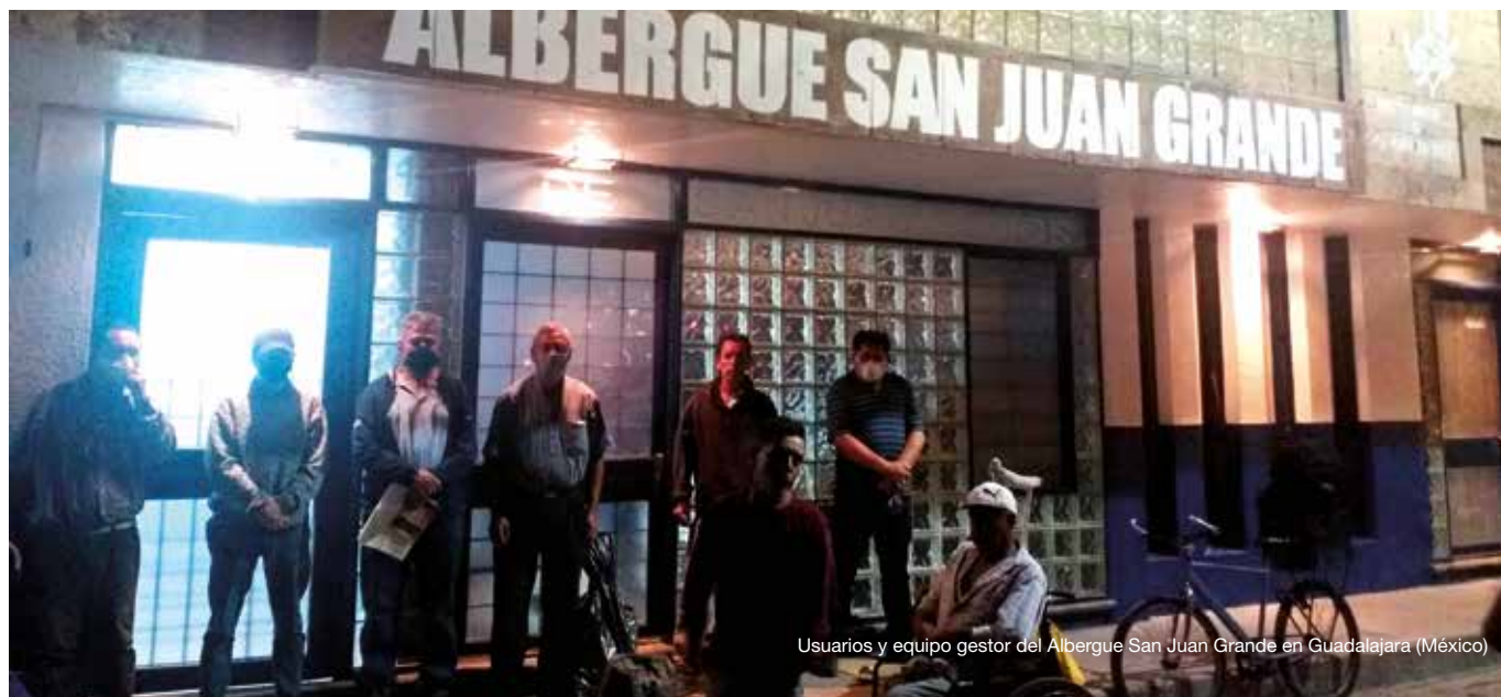
Usuarios y equipo gestor del Albergue San Juan Grande en Guadalajara (México)

Por su parte, la Fundación Jesús Abandonado, ha hecho una donación de 25 camas y 8 camillas del Hospital Virgen del Alcázar de Lorca, a través de MMUU-Murcia al Centro de reposo y albergue San Juan de Dios de Quito (Ecuador) para reforzar el alojamiento de pacientes. Asimismo, han dado apoyo económico al proyecto de 'Formación a profesionales en prevención de contagios/infecciones' en Ghana, en los tres centros que San Juan de Dios tiene en ese país. Una formación en prevención y control de infecciones, para evitar futuras pandemias, poniendo especial enfoque en la COVID-19.