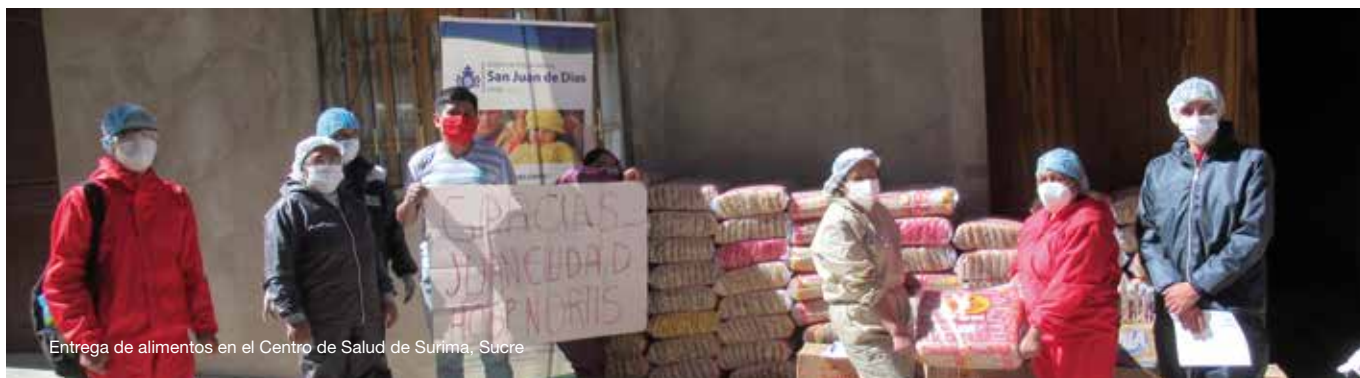
Entrega de alimentos en el Centro de Salud de Suríma, Sucre