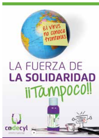
Campaña lanzada desde la coordinadora de Castilla y León

En todos ellos ha estado muy presente la pandemia de coronavirus, debido a las severas consecuencias que está suponiendo a nivel social y económico, especialmente para las personas más vulnerables. Por ello, Naciones Unidas ha alertado que debido a la COVID-19, se incrementará por primera vez la pobreza extrema en los últimos 22 años con cerca de 130 millones de personas entre 2020 y 2021.