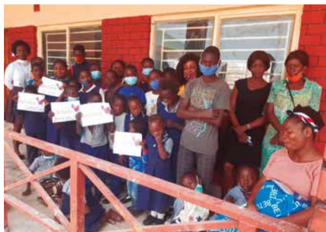
Maestra, usuarios y algunos familiares en la entrada de las clases del Centro de Rehabilitación de la Sagrada Familia en Monze