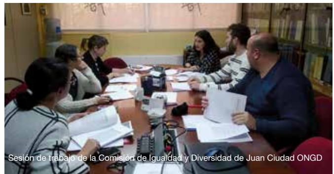
Sesión de trabajo de la Comisión de Igualdad y Diversidad de Juan Ciudad ONGD

AEROMAR LOGÍSTICA, S.L. TRANSPORTES INTERNACIONALES TRANSITOS-ALMACENAJE-ADUANAS