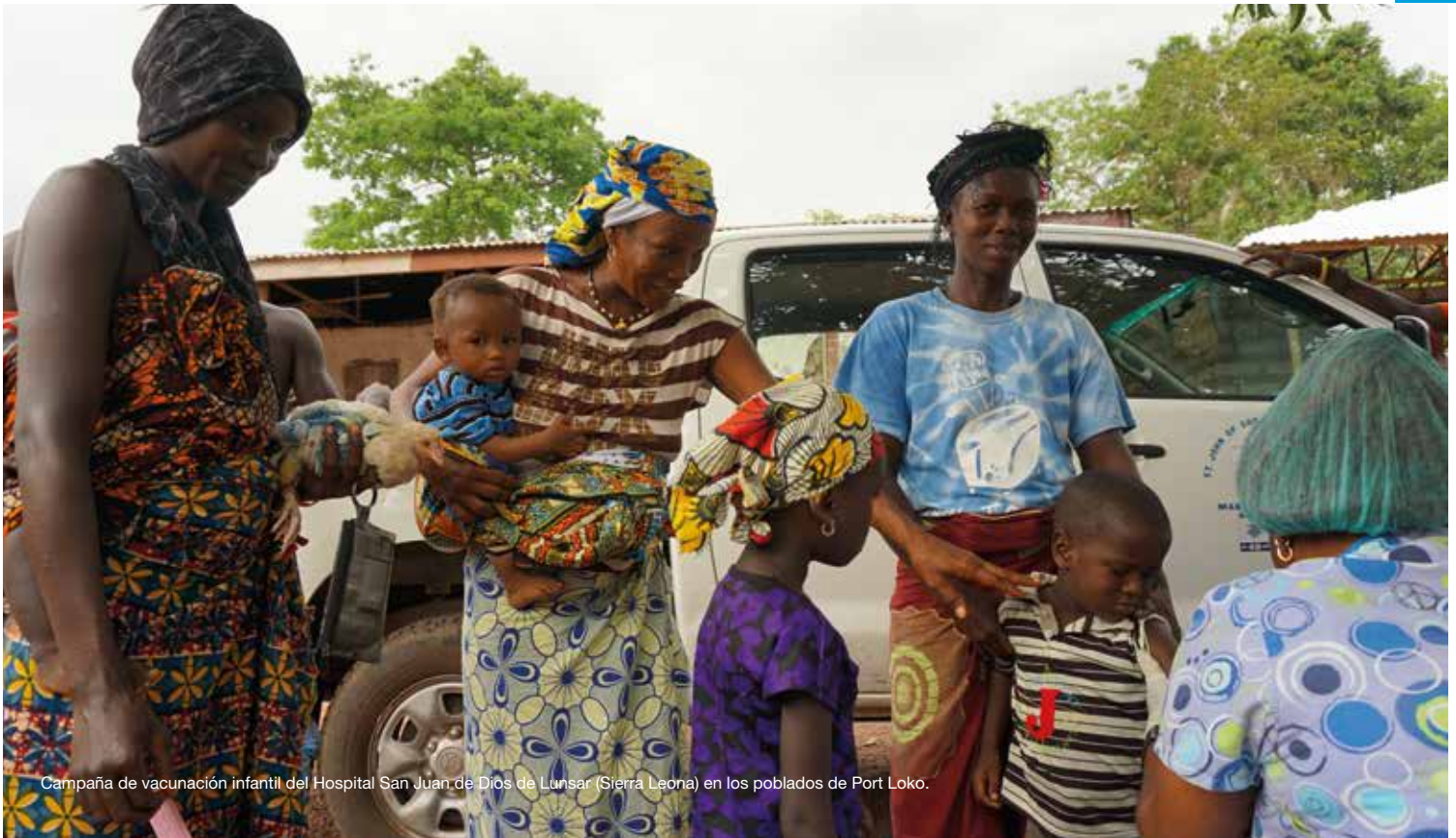
Campaña de vacunación infantil del Hospital San Juan de Dios de Lunsar (Sierra Leona) en los poblados de Port Loko.

Las colaboraciones económicas realizadas a Juan Ciudad ONGD tienen derecho a deducción tanto en el Impuesto de la Renta de las Personas Físicas, como en el Impuesto de Sociedades. ¡Infórmate! www.juancidad.org