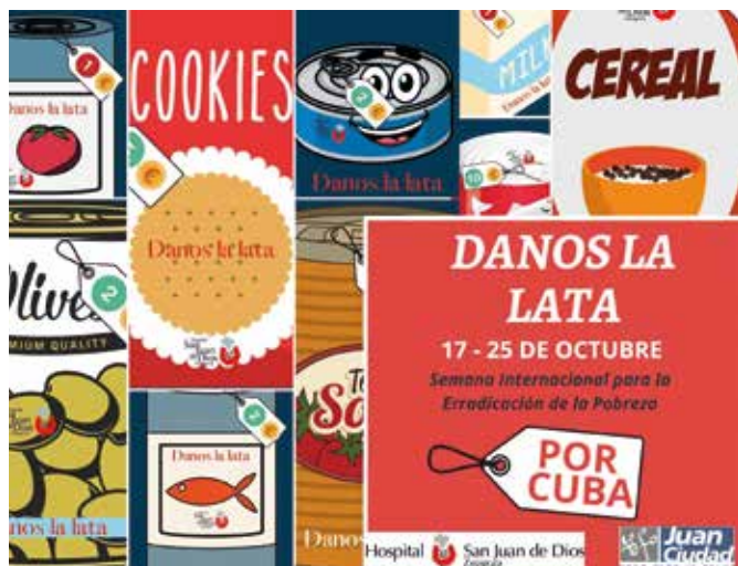
Cartel de la campaña "Danos la lata" Zaragoza 2020

Agradecemos toda la ayuda prestada por el personal del Hospital San Juan de Dios de Zaragoza y las personas voluntarias que han colaborado con esta campaña de "Danos la lata".