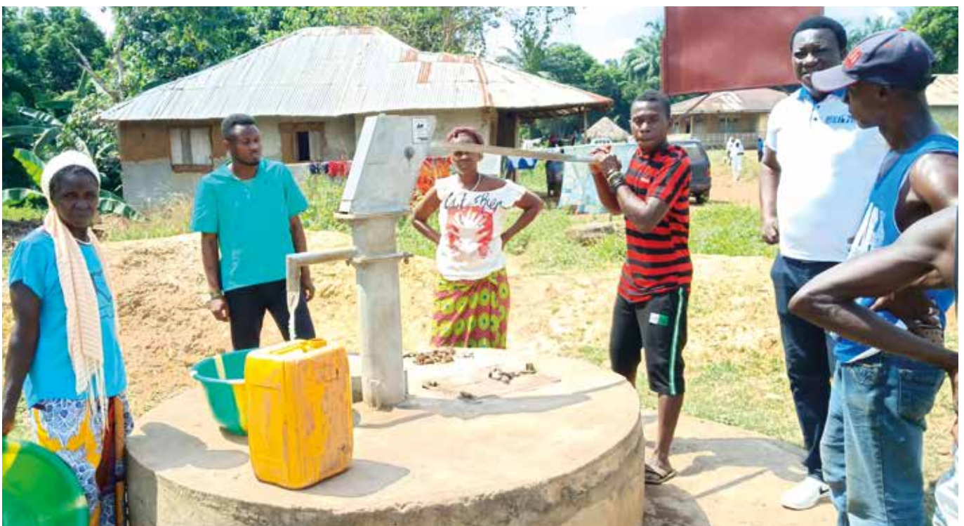
Vecinos de la comunidad de Mange y personal del SJG Hospital de Lunsar extrayendo agua de un pozo

Es tiempo de carencias de recursos, de limitaciones económicas, de cambios organizativos continuos, pero también es el momento de desaprender lo habitual y aprender otras maneras de hacer, de ser más flexibles, más emprendedores y de buscar la calidad del cuidado a través de la calidez y cercanía.