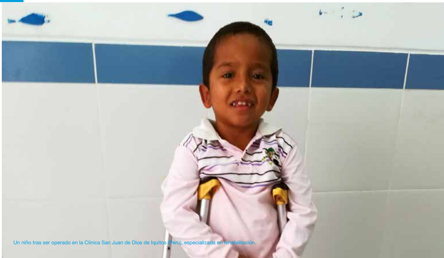
Un niño tras ser operado en la Clínica San Juan de Dios de Iquitos (Perú), especializada en rehabilitación.