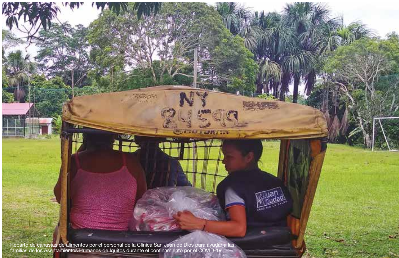
Reparto de canastas de alimentos por el personal de la Clínica San Juan de Dios para ayudar a las familias de los Asentamientos Humanos de Iquitos durante el confinamiento por el COVID-19

En un mundo donde es notable la falta de humanismo es imprescindible y necesario un liderazgo ejemplar de nuestros responsables y gestores. La ejemplaridad de sus hechos y palabras como signos de servicio y de hospitalidad. Necesitamos mirarnos en referentes que nos orienten, que nos sirvan de brújula y que nos ayuden en los momentos de turbulencias.