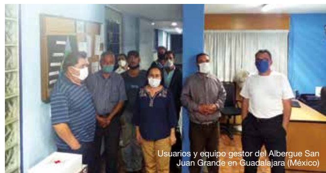
Usuarios y equipo gestor del Albergue San Juan Grande en Guadalajara (México)

Aprovechando esta experiencia, también han entrado con contacto con el Albergue San Juan de Dios de Quito, Ecuador. En este caso inicialmente tuvieron que cerrar el albergue entero, y con SJD Serveis Socials Barcelona compartieron medidas en la organización de