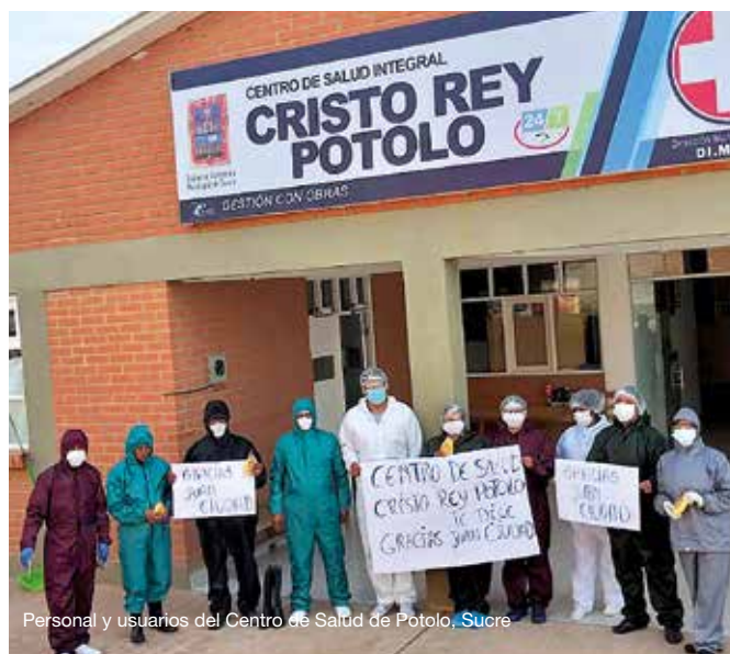
Personal y usuarios del Centro de Salud de Potoolo, Sucre

Una inmensa labor que realizamos gracias a gente como tú, que nos apoya económicamente, así como a organismos públicos que subvencionan parte de nuestros proyectos, y a otras entidades privadas que también colaboran con nuestra actividad. Además, la Orden Hospitalaria a través de sus curias en Roma y España, y los centros de San Juan de Dios en nuestro país, mantienen su compromiso con la cooperación internacional para el desarrollo, ya que la Hospitalidad es universal y no entiende de fronteras.