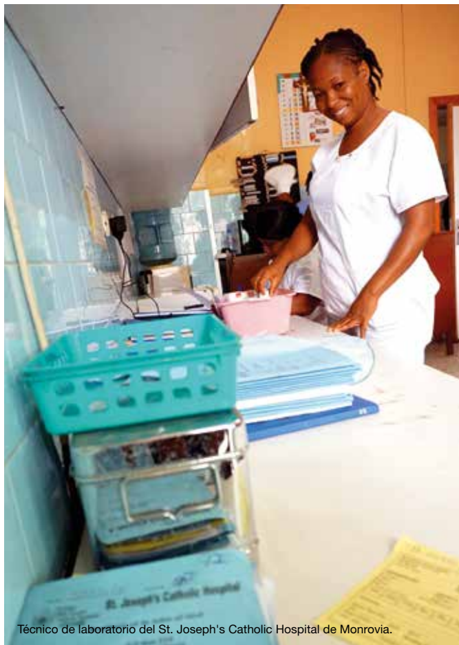
Técnico de laboratorio del St. Joseph's Catholic Hospital de Monrovia.