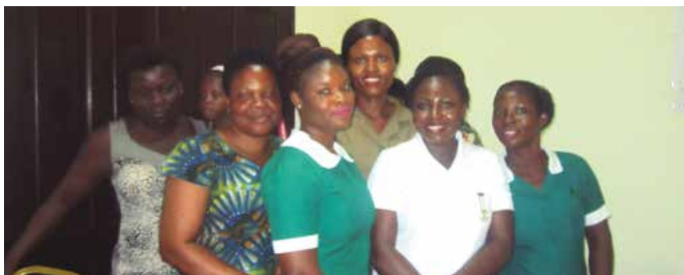
Algunas de las beneficiarias con los productos elaborados gracias a la formación recibida en el programa